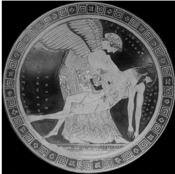
Slika 3. Douris, Eos i Memnon, kyliks, keramika, 490-480.pr.Kr., 26,7 cm, Louvre, Paris.

da umjetnik otkriva svoje skriveno, potisnuto shvaćanje biti čovjekovog postojanja i prirode. Na taj način umjetnik prikazuje i oblikuje stvarnost. Kao takva, umjetnost dobiva autonomiju suprotstavljajući se realnosti. Međutim, umjetnost kao sloboda govora nailazi na mnoge zapreke, rasprave i prigovore kroz vremena u kojima djeluju umjetnici. Ako za primjer uzmemo antičku umjetnost (Slika 3) koja je temeljena na kanonima, i modernu umjetnost (Slika 4) koja u potpunosti negira te iste kanone, vidimo da zapravo „važnost“ umjetničkih djela ovisi o društvu i vremenu u kojem nastaje određeno umjetničko djelo. Moderna umjetnost omogućuje neiscrpna eksperimentiranja kako bi se upotpunila estetska forma. Upravo zbog toga novo, tehnološko doba neosporivo je vezano za umjetnost, kao i umjetnost za tehnologiju.