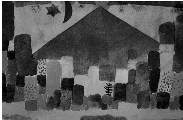
Slika 4. Paul Klee, The Niesen, 1915., akvarel i olovka na papiru, 17,7x26 cm, Hermann and Marguerite Rupf-Stiftung.

Estetski kriterij umjetničkog djela nedvojbeno je promjenjiv kod onog tradicionalnog i onog modernog, time omogućujući drugačiji pristup umjetničkom djelu. Umjetnost ponekad dobiva formu realnog ili irealnog kojim nagovještuje nove spoznaje o stvarnosti, novi realitet u kojem transformacija, kao fikcija ili ne, odaje inovativni svijet umjetnikovih zamisli i čovjekovih mogućnosti. Estetika se prema tome nalazi u ljudskoj osjetilnosti. Ona izaziva