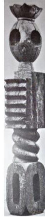
Slika 6. Constantin Brancusi, Kralj kraljeva , 1930., hrastovina, visina 3 m, Solomon R. Guggenheim Museum, New York (Arnason 2009., str. 154)