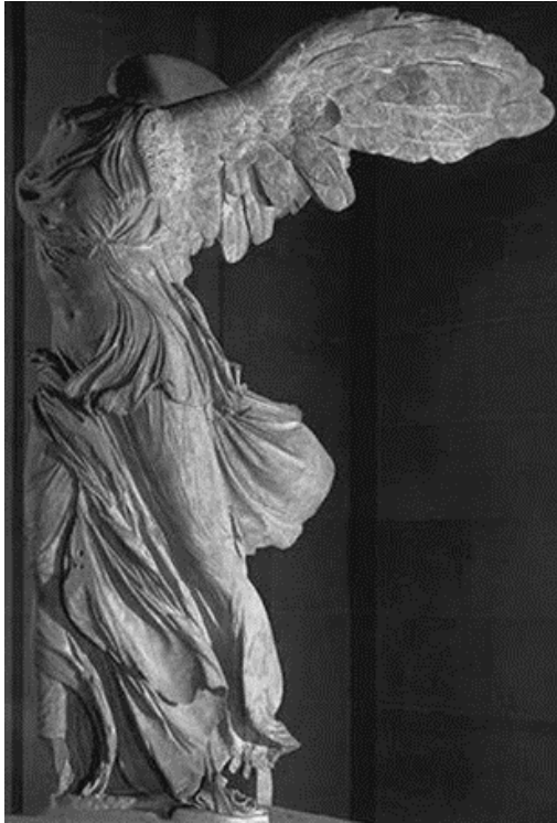
Slika 5. Pitokrit, Nika sa Samotrake , 200.-190.pr.Kr., mramor, visina 2,4 m, Louvre, Pariz (Janson, 2005., str. 161)