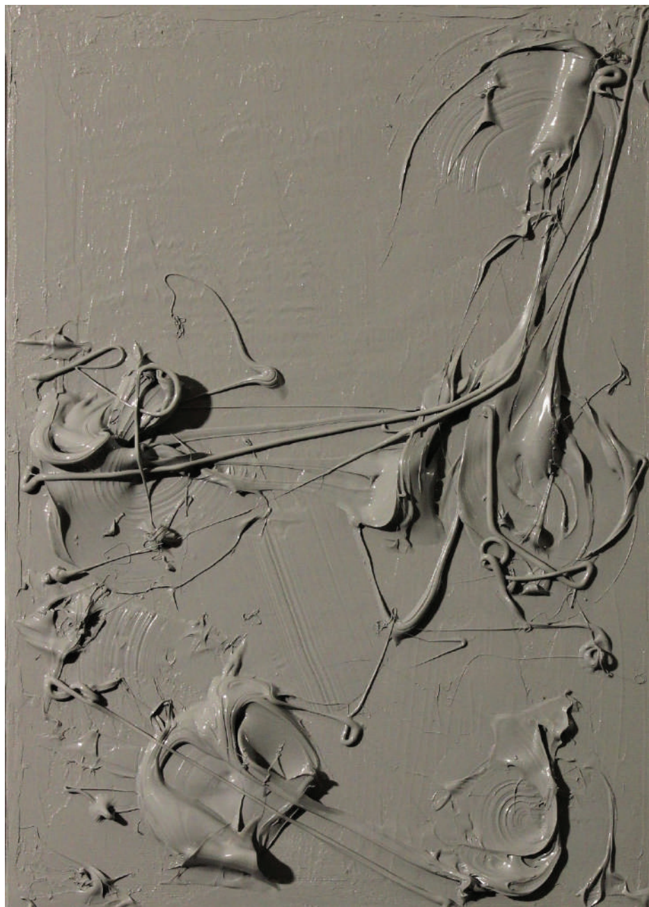
"Silikonologija (SI3)" 35x25cm, 2021.