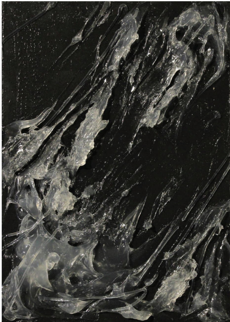
"Silikonologija (PR1)" 35x25cm, 2021.