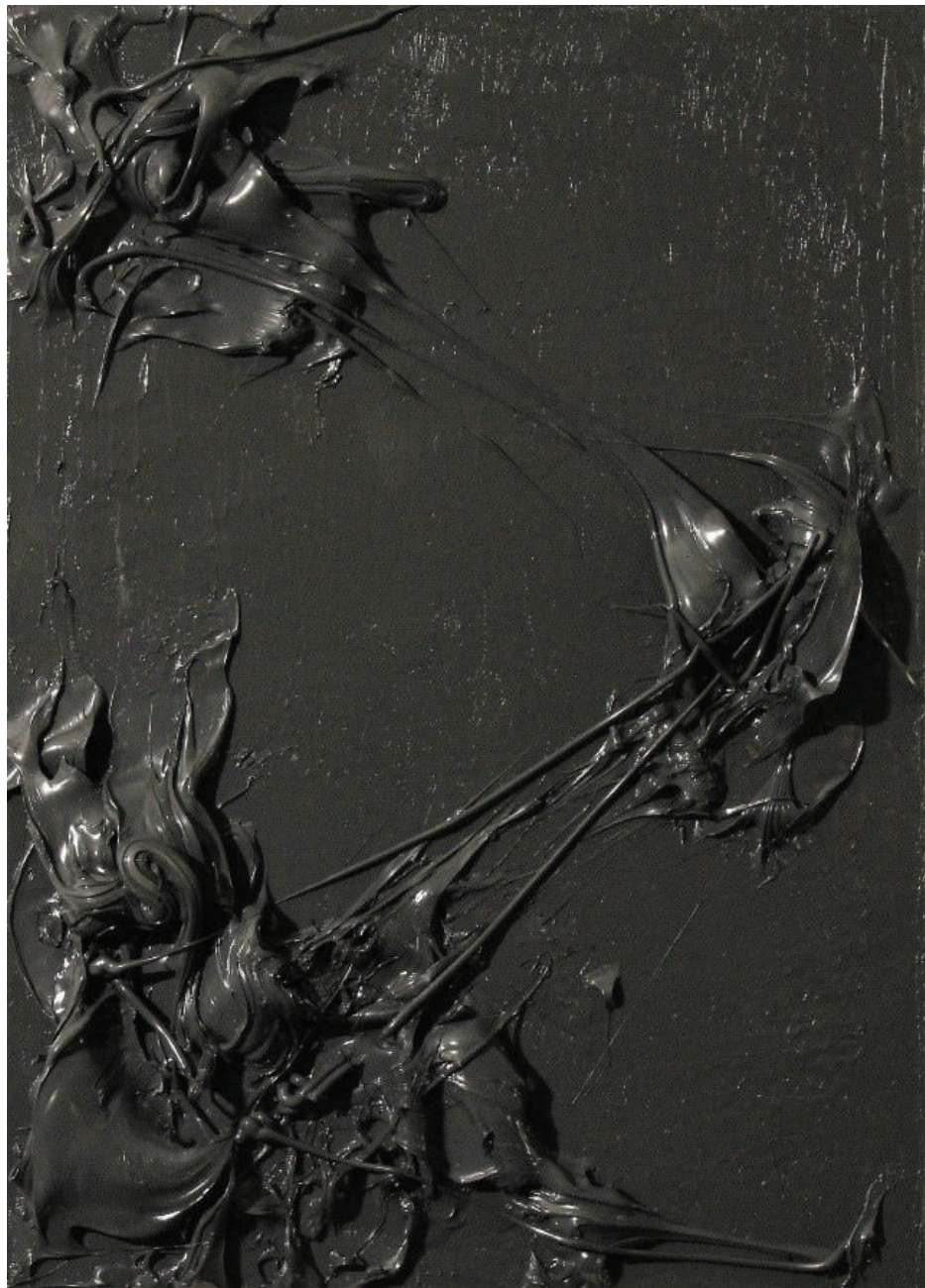
"Silikonologija (AN3)" 35x25cm, 2021.